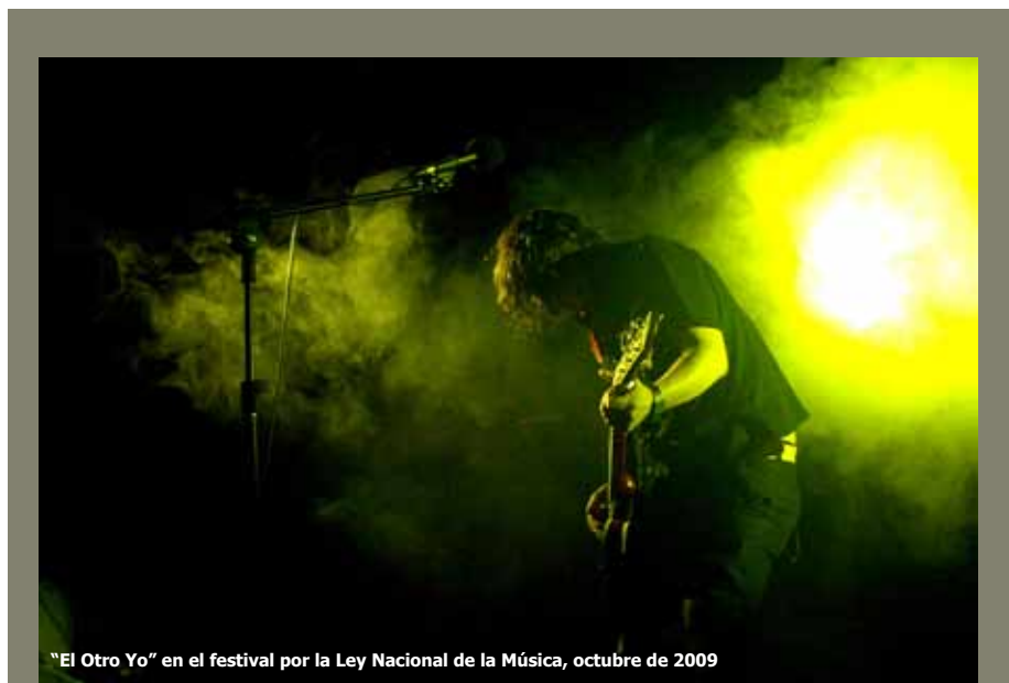
"El Otro Yo" en el festival por la Ley Nacional de la Música, octubre de 2009

¡Por la Ley Nacional de la Música! Para más información www.musicosconvocados.com