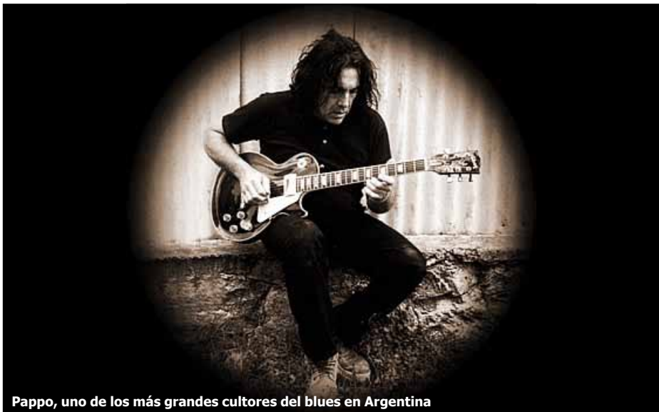
Pappo, uno de los más grandes cultores del blues en Argentina

El blues es una música que tiene su origen cultural en África occidental, y que fue llevada por los esclavos al sur de los Estados Unidos, especialmente al delta del Mississippi. La comunidad negra de aquel país la desarrolló a través de negro spirituals, canciones de trabajo, gospels y otras formas. Con el tiempo, este género llegó a influenciar de manera terminante a la música popular norteamericana y a la occidental en general, hasta convertirse en parte fundamental de géneros como el jazz, el rock, el funk, el soul, el hip hop e incluso gran cantidad de canciones pop.