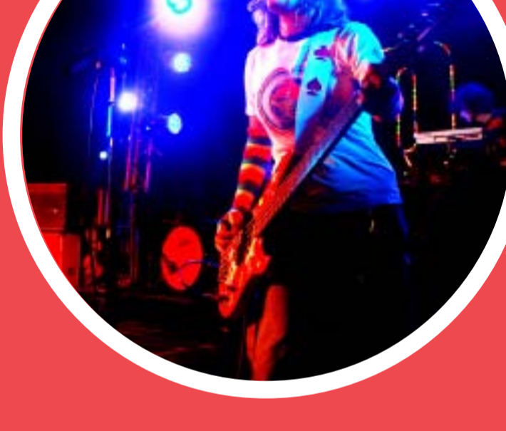
Festival por la Ley de la Música, realizado en el ECUNHI en octubre de 2009