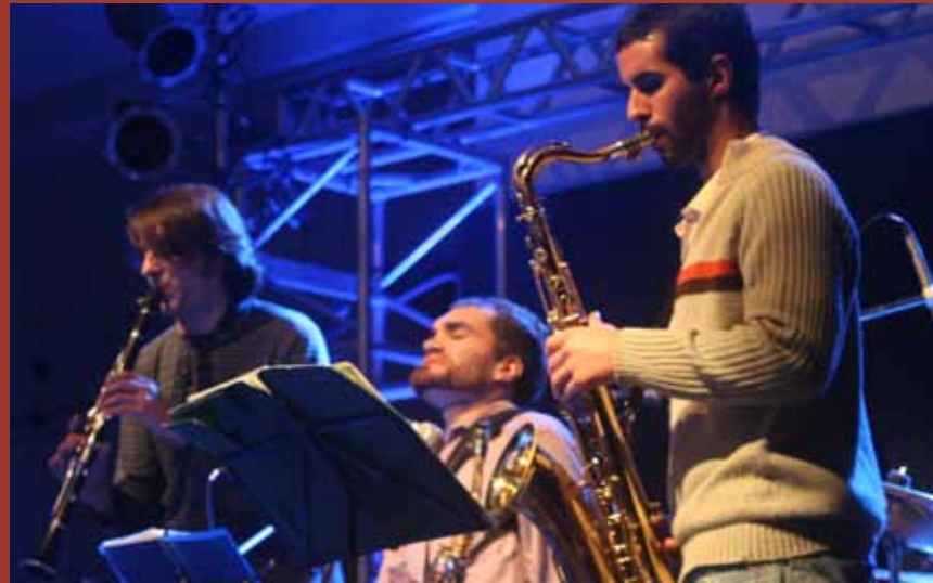
"La banda hermética", durante su presentación en el Espacio Cultural Nuestros Hijos

También pueden efectuarse consultas a escenariojazz@gmail.com