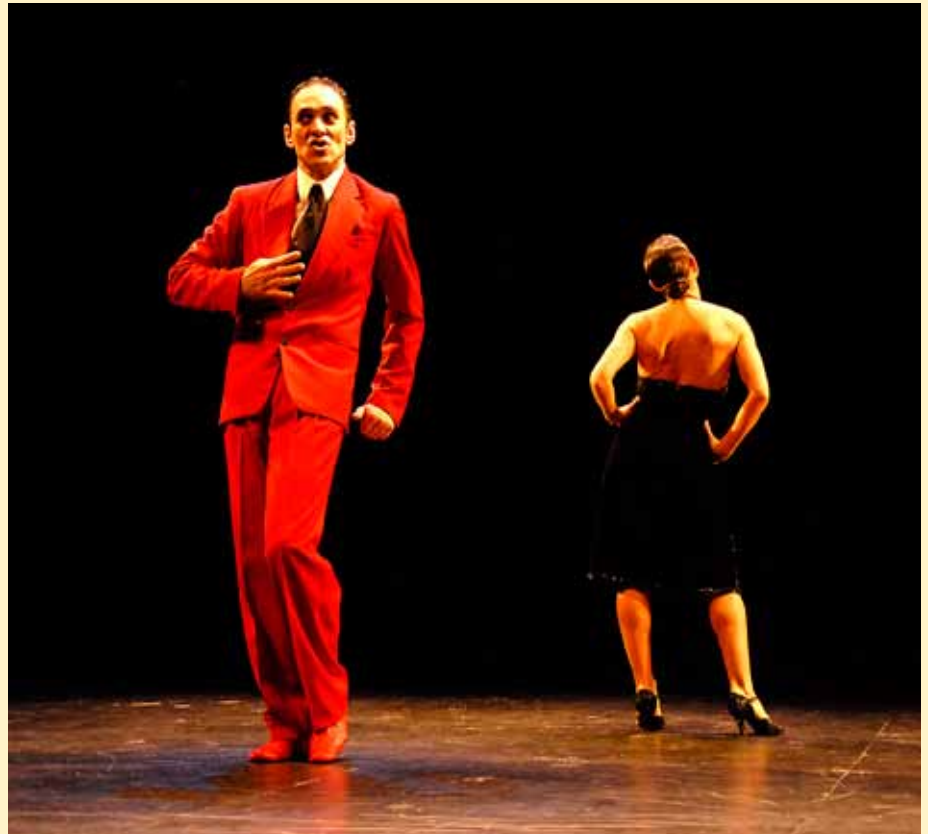
"Cabalgata en pequeño formato" se presentó en el escenario principal del ECuNHi el 14 de octubre

Desde el cine, como desde la poesía, la pintura o la escultura, el autor intenta transmitir con herramientas poéticas los aspectos que más lo sensibilizan de una historia, una escena o un concepto. Y en este sentido, el arte, como vía para adueñarnos del mundo, no es puro ni debería serlo.