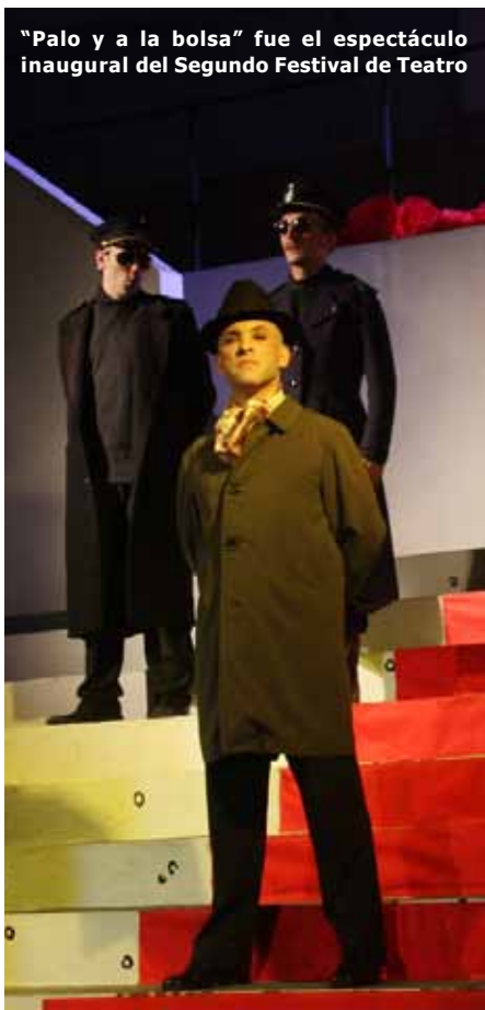
"Palo y a la bolsa" fue el espectáculo inaugural del Segundo Festival de Teatro

El día 9 de este mes se inaugurará una gran biblioteca general en la Carpa que las Madres montaron en el Paseo del Bicentenario y que ahora forma parte de las instalaciones del Espacio Cultural Nuestros Hijos en la ex ESMA. Esta biblioteca estará abierta al público, y contendrá obras de ficción, poesía y ensayo. A modo de homenaje, llevará el nombre de Hamlet Lima Quintana, el gran poeta argentino, un autor prolífico, exponente de la poesía popular, dueño de una estética personalísima y, sobre todo, un militante coherente tanto en el arte como en la vida.