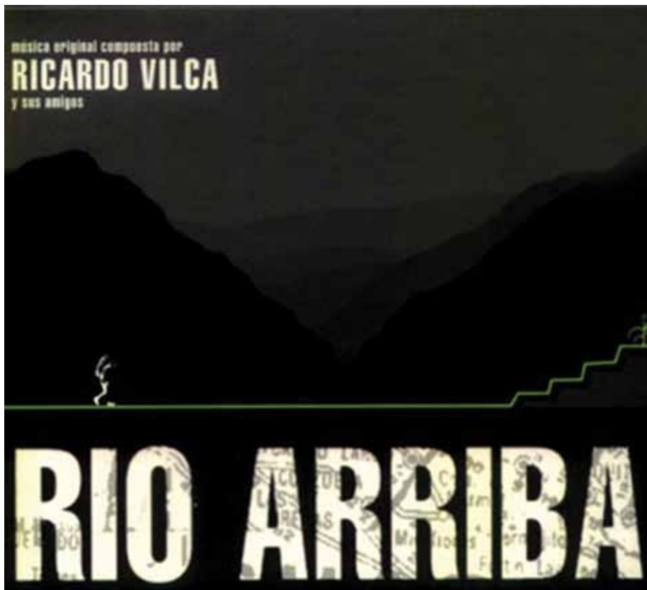
El 9 de septiembre se proyectó la película "Río arriba" (Ulises de la Orden, 2006), en el marco del Ciclo de Cine Documental "Bicentenario latinoamericano".