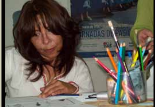
Una alumna de taller trabajando