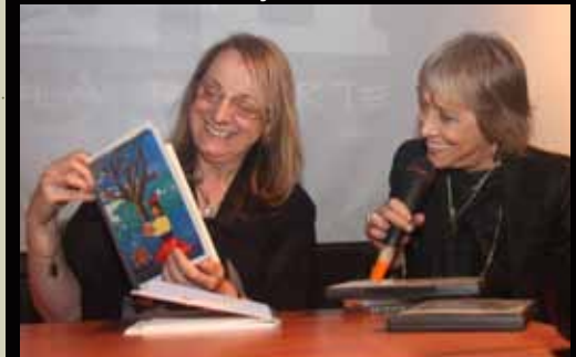
Alicia Kirchner recibe un libro realizado por adultos mayores