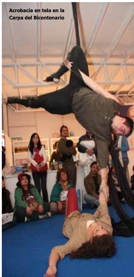
Acrobacia en tela en la Carpa del Bicentenario

Las clases del ciclo lectivo 2011 en el Espacio comenzarán en el mes de abril. Habrá talleres propuestos por las áreas de Artes Visuales, Letras, Música, Musicoterapia y Teatro. Con precios muy accesibles, sin pago de matrícula, trabajo en grupos reducidos y un perfil propio muy definido, a los talleres del Espacio Cultural Nuestros Hijos les sobran razones que explican su éxito. Desde el 15 de febrero, en www.nuestroshijos.org.ar