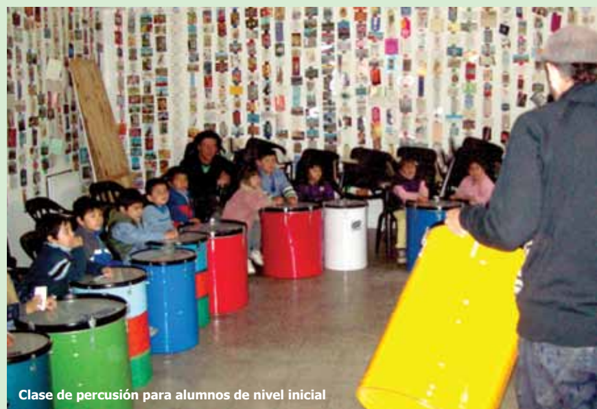
Clase de percusión para alumnos de nivel inicial

En el año 2011 se continuará con este programa, ampliando la cantidad de escuelas que nos visitan y profundizando la propuesta didáctica. Aquellas instituciones educativas que deseen participar, pueden comunicarse por correo electrónico y solicitar la visita a proyectoeducativo@nuestroshijos.org.ar