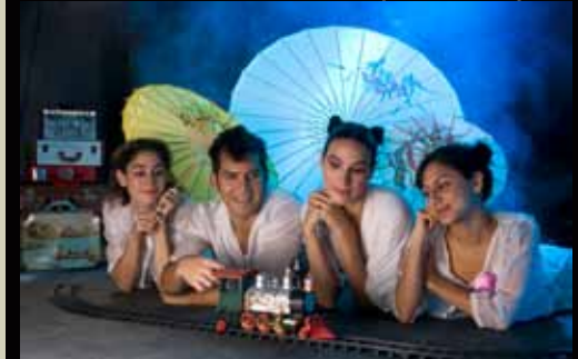
Segundo Festival Nacional de Teatro "Celebración"